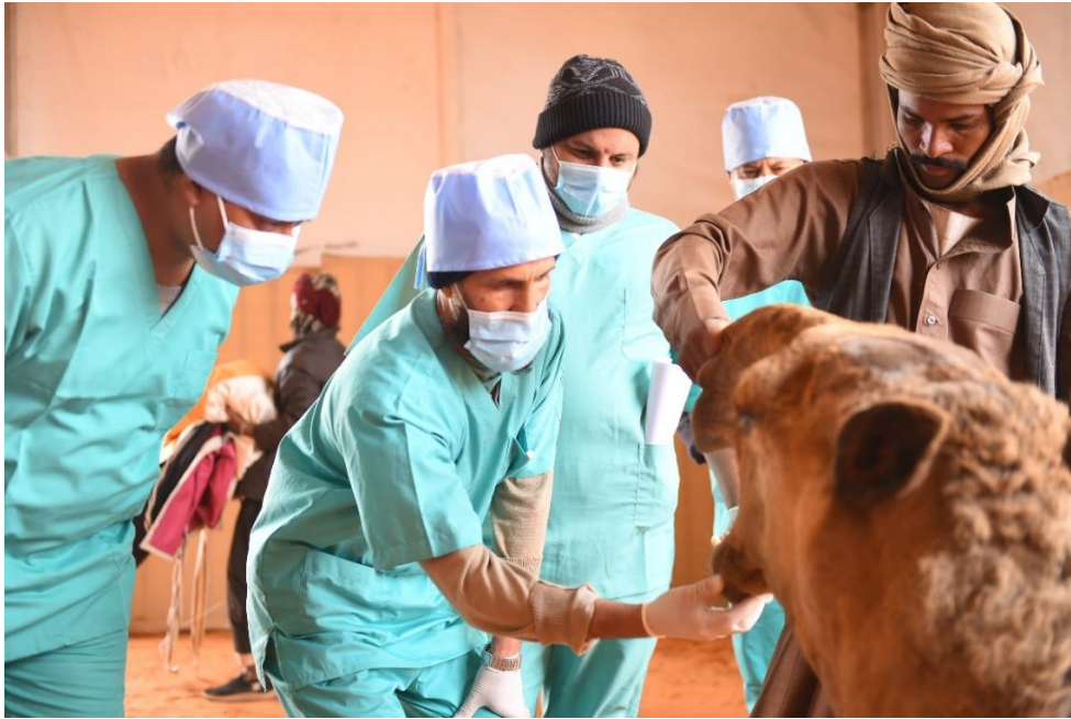
اللجنة الطبية البيطرية لفحص الغش أثناء فعاليات مهرجان الملك عبدالعزيز للإبل في نسخته الثالثة